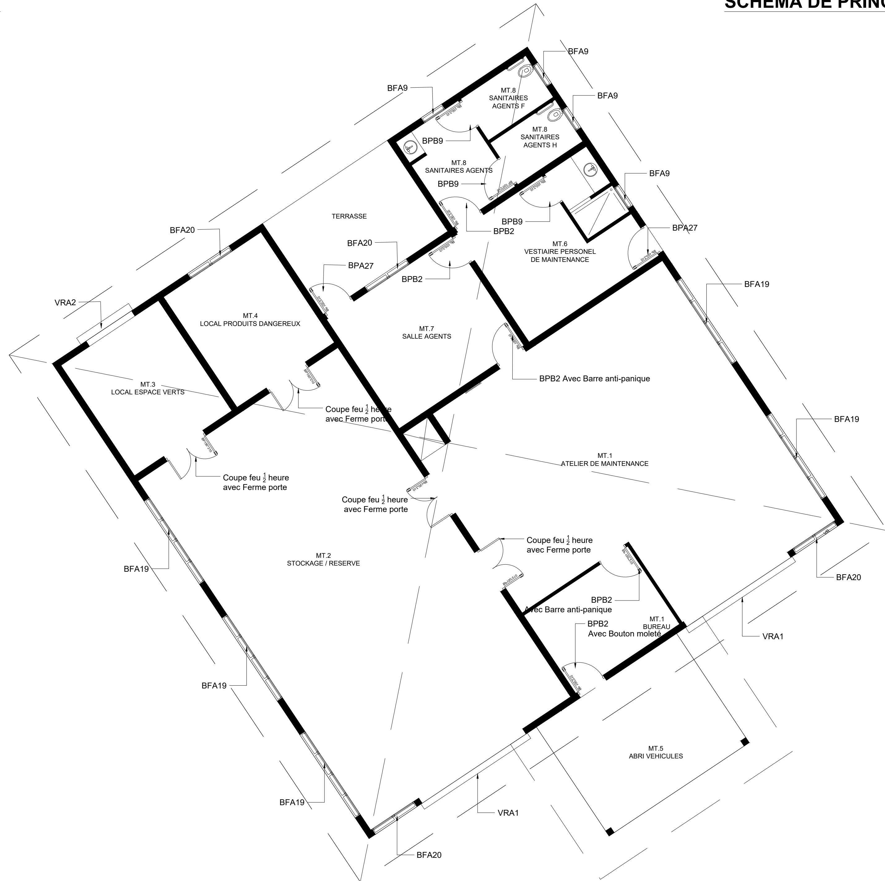
SCHEMA DE PRINCIPE DES MENUISERIES